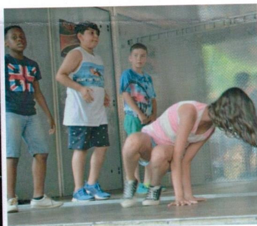
Breakdance lernen und vor Publikum aufführen können!