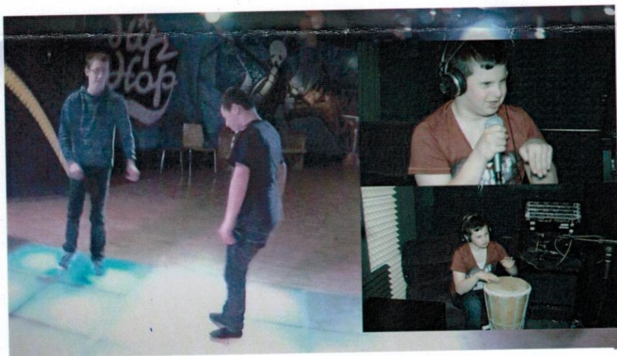
Im Tonstudio den eigenen Song aufnehmen können