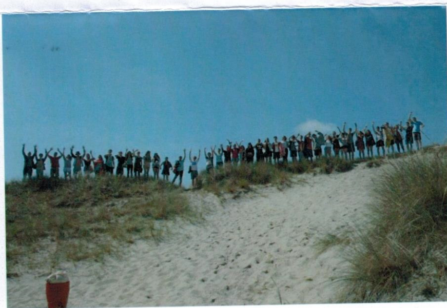
Atemberaubende Naturerlebnisse auf der Jugendfreizeit in Dänemark